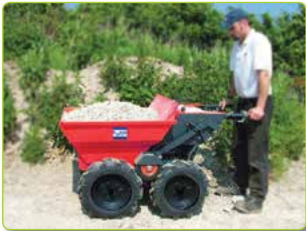
操作员快捷简易地使用HTL350运输砂石