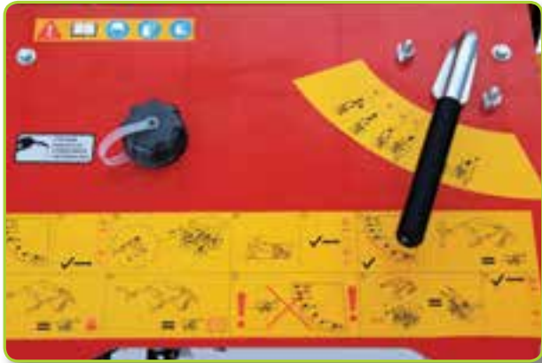
综合控制板与简易操作说明