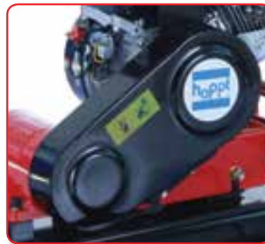
防护罩具防污功能，保护与延长皮带的使用寿命