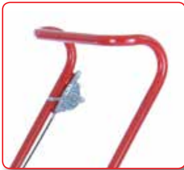
非常耐用的油门控制