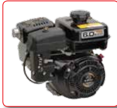
引擎可依据用户所属国家而选择，便于维修