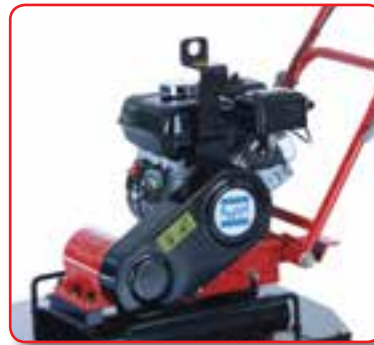
便于运输的起重吊钩与装卸点