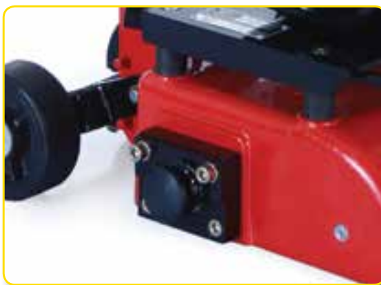
插入工业真空软管的真空出口，以吸除碎粒，从而保持施工地点的清洁