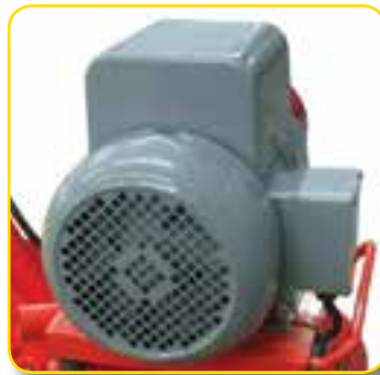
引擎与电动马达可供选择